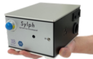
超小型ガスクロマトグラフ